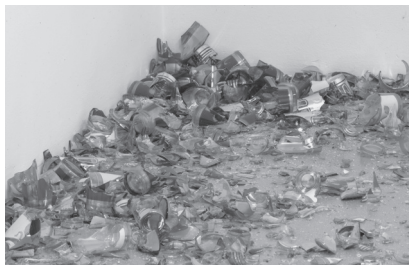
‘Erratum’, 2004-2009 Kapot gegooide theeglazen/ Tea glasses smashed on site

Courtesy of the artist and kamel mennour, Paris