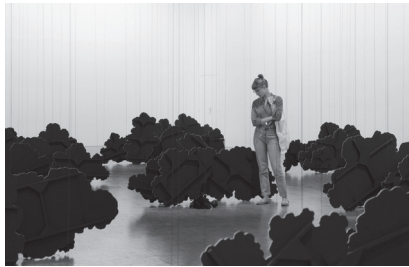
‘L’air du temps’, 2014 Foto / Photo: Fabrice Seixas Courtesy of the artist and the galleries: Dvir, Tel Aviv;

kaufmann repetto, Milan; kamel mennour, Paris; Eva Presenhuber, Zurich